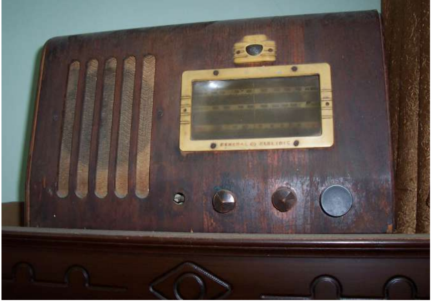
1957'de Konuklara Ait Radyo