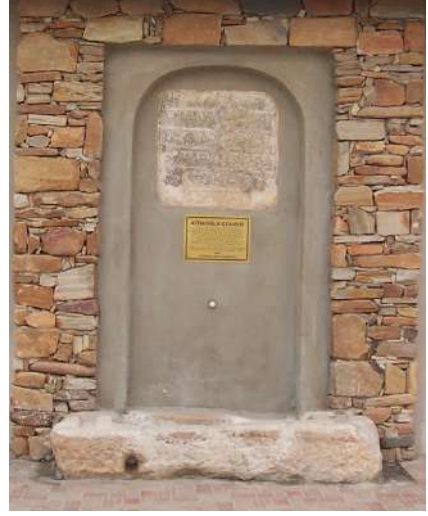
Hacı Salihler Çeşmesi Bu Çeşme Gibiydi

Bu sözlerden sonra Rüşdî ve onun fikrine katılanlar iki sene içinde Tekke Deresi denilen 8 km kadar bir mesafeden kasabaya künkler içinde su gelmesini sağladılar. Hamamı haftada iki gün çalışır hâle getirdiler.