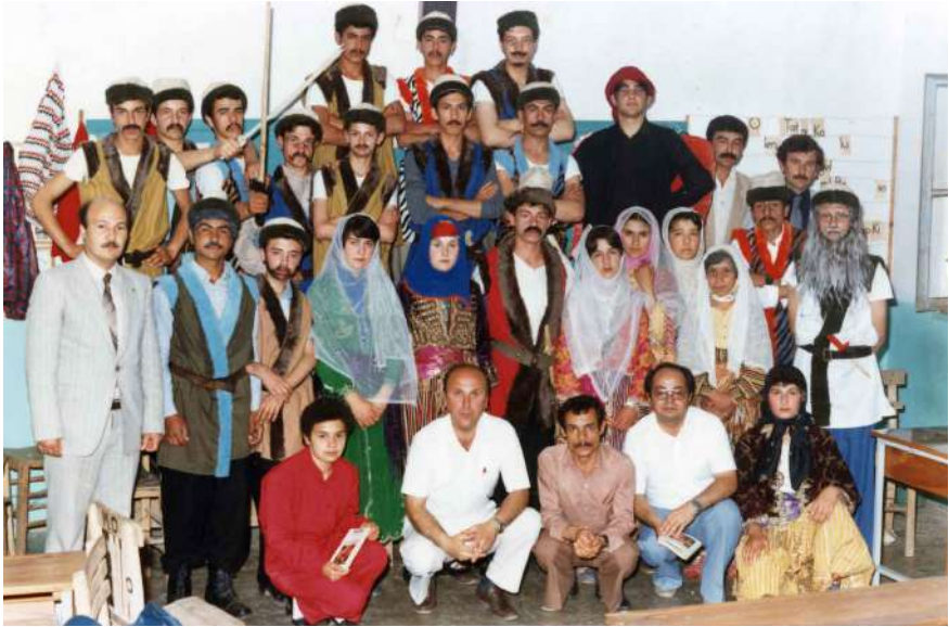
Karacasu Lisesi Öğrencileri Deli Dumrul Oyununda

Bütün öğrencilerimiz anlamlı ve değerli başarılar sağladılar okul sonrası yaşamlarında; ama en önemlisi hayatın içinde namuslu, çalışkan, dikkatli durdular. Güzel sanatlara; şiire, müziğe... ilgileri hep devam etti. Tam da istediğimiz gibi hayatın tam içinde bilgiden ve çağdaş yaşamdan yana oldular.