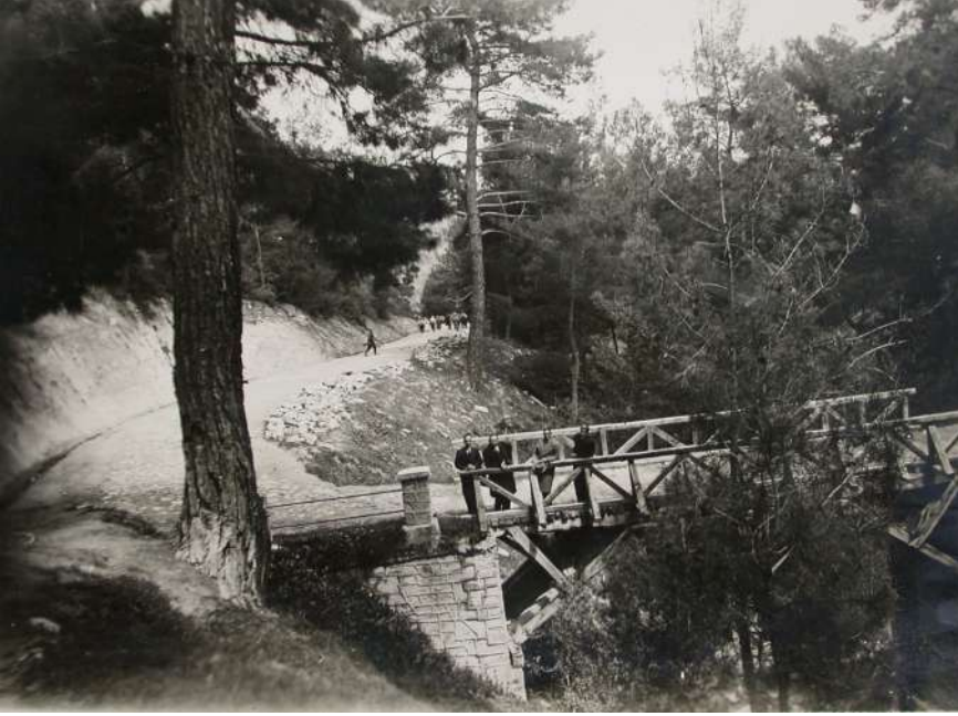
1938'lerde Karacasu Nazilli Yolu

kılmış; ama yola devam edilememiş. Lastik patlamıştır. Bütün yolcular inmişler. Muavin krikoyu çıkarmış. Otobüsü kaldırmış. Bijonlar gevşetilmiş. Levyelerle dış lastik bin bir güçlkle çıkarılmış. O zamanları yedek lastik genellikle olmazmış. İç lastik bir futbol topu gibi şişirilmiş. Lastikteki delik bulunmuş. Kaynak makinesi getirilmiş, sıcak kaynak yapılmış. Hadi bakalım, her şey geriye doğru tekrar yapılmış. İç lastik dış lastiğin içine yerleştirilmiş. Levyelerle dış lastik jant içine oturtulmuş. Bundan sonrası en zor işmiş. Basit bir pompayla koca lastik yarım saatte şişirilmiş. Sözü uzatmayalım. 2 saat sonra yolcuların sabırsızlığı, hoşnutsuzluğu içinde tekrar yola çıkılmış. O zamanlar Kuyucak'a posta bırakmak için mutlaka uğranılmış. Kuyucak'a geldiğinde saat 17'ye gelmiş. Ama postaneye ulaşamamışlar; Kuyucak İstasyonu'nun önünde kalmışlar. Çünkü otobüsün lastiği tekrar patlamış. Saatler yine hızla geçip gitmiş. Başaran'da yapılanlar sırasıyla aynen tekrarlanmış. Ortalık kararmış. Tekrar yola çıkmışlar Nazilli'ye doğru.