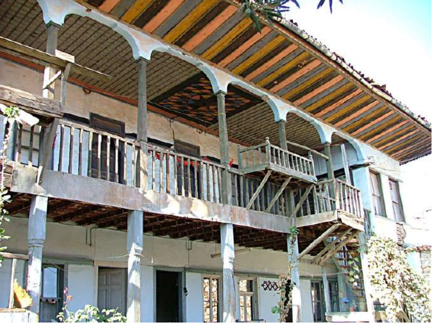
Tekkeşinler Evi'nin 2008'deki Görünüşü