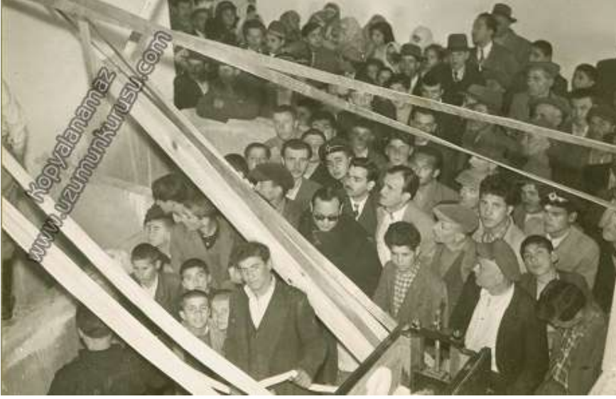
Fabrikanın Açıldığı İlk Gün