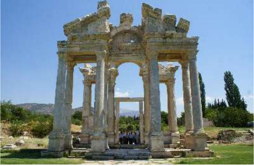
Afrodisias Anıtsal Kapı

de Karacasu kültürünün diğer bazı örnekleridir. Her Karacasulu bu kültür ortamında yaşar, içinde doğduğu kültürel ortamın özelliklerini annesinden babasından, yakınlarından, arkadaşlarından, okuldan, sokaktan ve iş ortamından öğrenir.