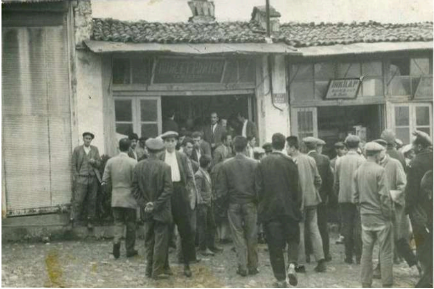
1960'ra da Dua Meydanı

duğu eve de rastlıyoruz. Biraz ilerde evlerden ayrı bir tarla içine yapılmış boya ve apre fabrikası evlerden tikitak diye muntazam tempo tutan sesleri ile ruhlarda ayrı bir zevk yaratan tezgâhların çıkarttığı malları işte bu fabrika düzene koyuyor, boyuyor. Her çulhanın elde ettiği mal piyasaya uygun bir düzen verdiği için kuran müteşebbisleri ne kadar tebrik etsek azdır.