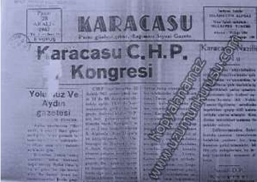
1947'de Karacasu'da haftada bir KARACASU isimli bir gazete çıkarılırdı.

“Karacasu halkının büyük kısmının parası yoktu. Dokumacılar Kooperatifine üye olanlar bir hafta için 5 topan iplik alırlardı. Bu 5 topan ipliği işlerler tekrar kooperatife bez olarak satarlardı. İyi para kazanırlardı. Hele hele iplik temin edip de kooperatif dışında, tüccarlara mal satsarlarsa daha çok para kazanırlardı. Bir hafta gece gündüz çalışırlar kooperatife mal götürürlerdi.” 8