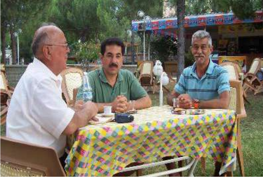
Mösyö Herve İle Röportaj Günü