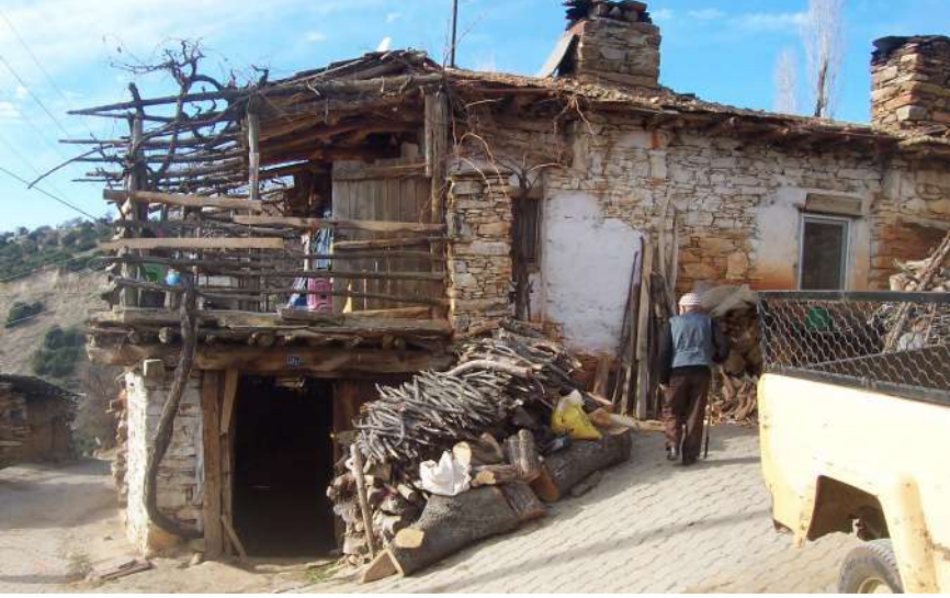
Yeniköy'de Bir Ev

yor. “Ya buralardan arabayla geçmesek de yaya olarak geçsek ne olacakmış!” diye kendi aramızda konuşuyoruz. Ama bu sadakate saygı duyuyoruz. Keşke köpekle iki kelam edebilseydik de ona bazı insanların, bazı toplumların, nesillerin büyük sadakatsizliklerini anlatabilseydik diyoruz. Yeniköy’ü bir vadi tabanında hayal ederdim eskiden. Hiç de öyle değildi. Sol yanını Babadağ’a verip giderek alçalan vadiye bakan bir sırt üzerinde kurulmuştu. Öğle güneşinde sanki ısınyordu. Öğle güneşinde pırıl pırlıdı. Sessizdi. Giderek çoğalmış kiremit damlı evlerle, çok eski zamanları çağrıştıran toprak damlı evler görünüyordu. Köy meydanında kimsecikler yoktu. Biraz ötede bize meraklı gözlerle bakan sakallı bir amca vardı. Evi de kendisi gibiydi. Köy kahvesi kilitliydi. Eczacı arabasının kornasını çalınca birkaç köylü geldi ilaçlarını almak için.