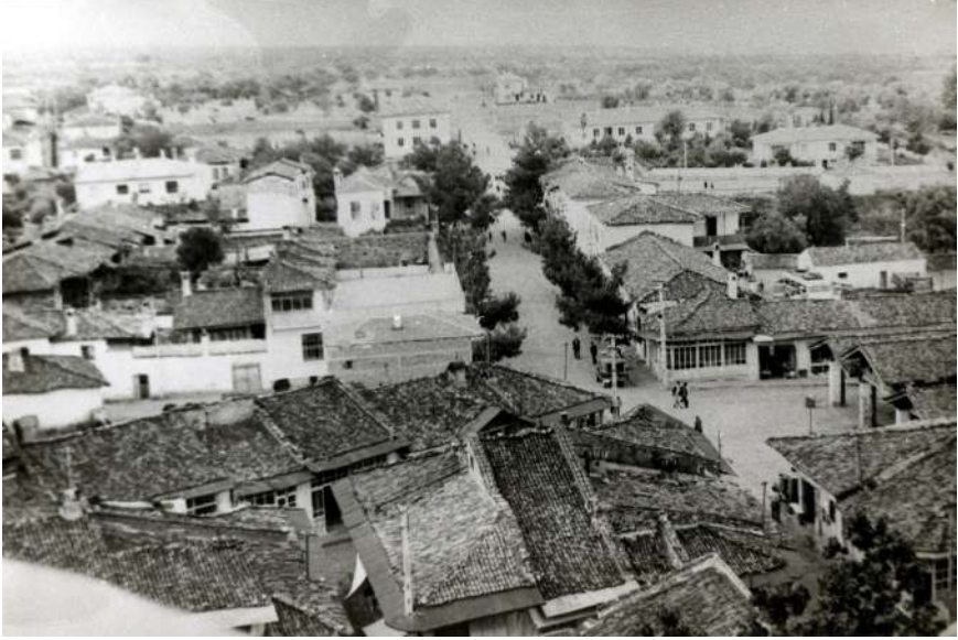
Yazıda Sözü Edilen Sağlık Yurdu, Doktor Evleri, En Önemlisi Lonca (Yoncaaltı) Resmin Sağ Alt Köşesinde Görülüyor. Yoncaaltı Pazar Yeri Olarak Kullanılan Üstü Örtülü Yerdi