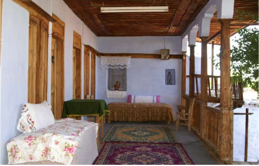
Geçmişteki Karacasu Evlerinden Birisi

önemlisi bu kültür varlıklarımızı bugünlere aktaran bir toplum olsaydık Karacasulu olarak, bugün, daha başka bir toplum içinde yaşardık. Sorunlarımızı daha çabuk saptar ve çözerdik. Demek ki kültür sadece yol, su, elektrik, süslü ev, son model araba yapma/kullanma bilgisi değildir.