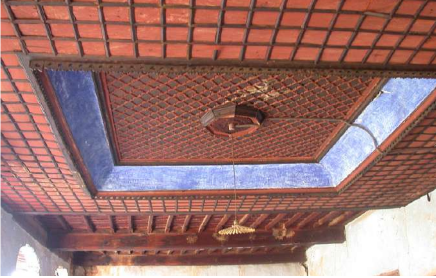
Karacasu'da Bir Eski Ev Tavanı

yük katkılar sağlamaktadır. Mesela Subaşı Mescidi'nin doğru anlayışla restorasyonu yine örnek olsun diye Vakfımızca gerçekleştirilmiştir. Köseoğlu Çeşmesi, Efendiler Çeşmesi doğru biçimde restore edilen kültür varlıkları olmuştur. Bir eski Karacasu evinin Cengiz Bektaş gibi büyük bir ustanın öncülüğünde restore edilmesi ise son yılların en göz alıcı restorasyon ve kültür çalışmasıdır. Hacret, Küçükarkık ve Cumaönü Camilerinin kurallara uygun bir biçimde restore edilmesi ise çok sevindiricidir, güzeldir. Karacasu'daki bütün tarihî kitabeleri anlaşılır Türkçeye çevirme ve bu yeni metinleri yerlerinde levhalar hâlinde asma işi ise çok anlamlı olmuştur. Etnografya Müzesi'nin açılması güzel bir çalışmadır. 1