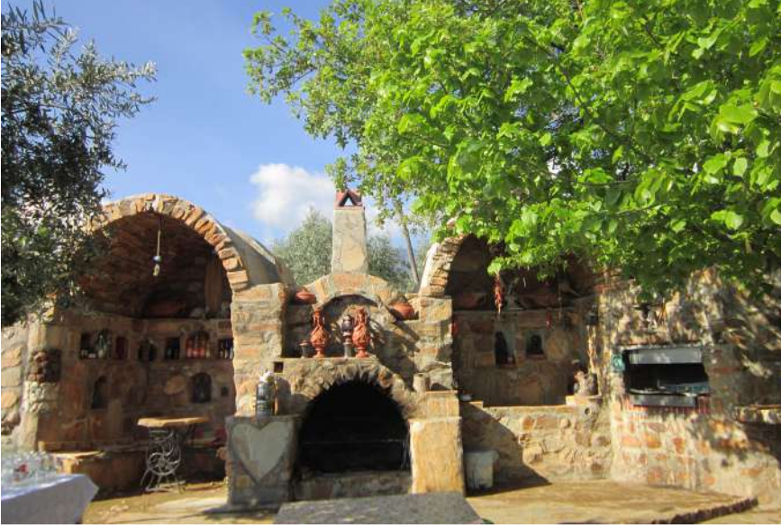
Erdoğan Orçun'nun Yaptıkları

Bense küçük bir devrimi başarabilen o hanıma, yaşadığı bütün zamanlarda, farklı bir gözle bakmakla kalmadım çoğu kez onunla konuşurken bu, aynı ev açışla ilgili hayranlığımı anlatmaktan kendimi alamadım.