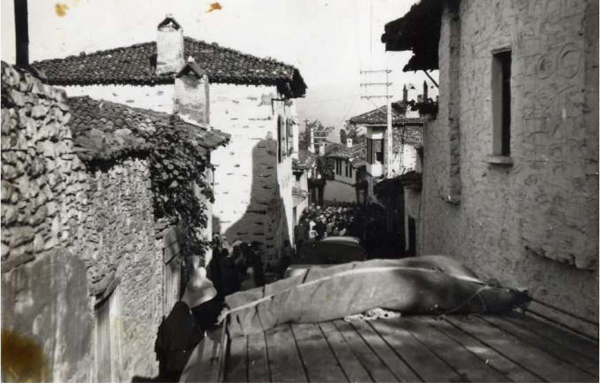
Tam da O Yıllarda Tekkeşinler Evinin Olduğu Sokak, Tekkeşinler Evi Fotoğrafın Sağından 2. Ev