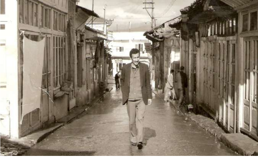
1970'lerde Dua Meydanı'ndan Acet Eczanesine İnen Yol

Yağlı paça yiyip Ahmet Deresi'nin suyunu içmeden gelenler Karacasu'yu görmemiş sayılır, dediler. Biz de gördüğümüzü ispat için bu adı geçen dereye gittik. Burada bahar tam manasıyla gelmişti. Derenin şırıldayan bu ahenkli sesini dinledik. Hark kıyılarından kır menekşeleri topladık. Berrak suyunu yüzümüze sürerek, içtik. Kuzukulakları yiyerek elimizde tutam tutam kır çiçekleri, dudağımızda şarkı olduğu halde derenizi asude havasının verdiği hoşlukla döndük.