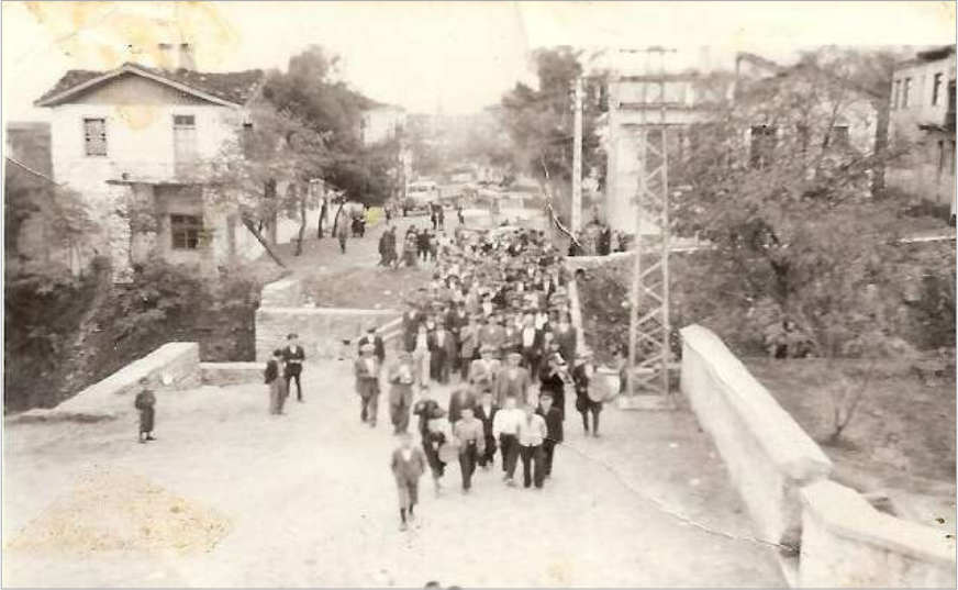
1957'lerde Karacasu Çarşısına Giriş