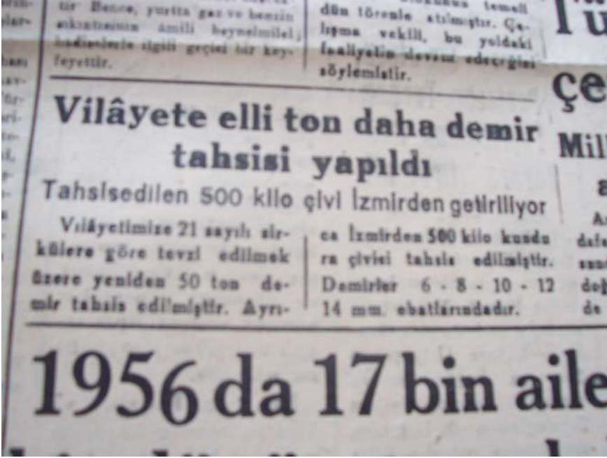
O Yıllardaki Bir Aydın Gazetesinden

ta bağladı. Kemal aldırmaı bu sözlere, beni halk seçti, halk buraya layık gördü de parti başkanlığına getirdi. İstifa etmem, dedi.