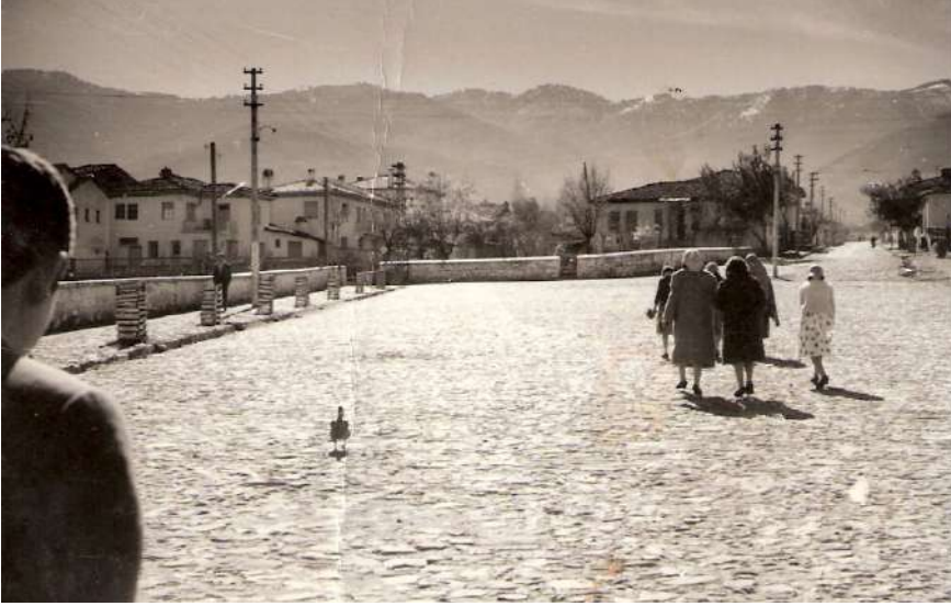
1955'lerde Kızak Kaydığımız Sokağımızın Girişi. Bugünkü Yayla Yolunun Başlangıcı.

şeklindeki sözleri ezgili bir şekilde söylemeye başlarlardı. Ev sahibi içeriden getirdiği şekeri, yumurtayı, küplerden çıkardığı ballı yemişleri, can veren pekmezli köfteleri, yani bunlardan hangisini verecekse onları, çocukların keselerine veya sepetlerine koyunca üzerlerine bir kova da su atardı. Sırılsıklam olan çocuklar hiç umursamazlardı bir kova suyun üstlerine atılmasına. Onlar yine bir masal dünyasının mahallesinde bir başka eve yine yeni yumurtalar, yeni köfteler, yeni şekerler edinmek hevesiyle sallana sallana “yağmur yağ yağ yağ; ambar dol dol dol” sözlerini söyleyerek şen şakrak bir düğün alayı sevinciyle giderlerdi.