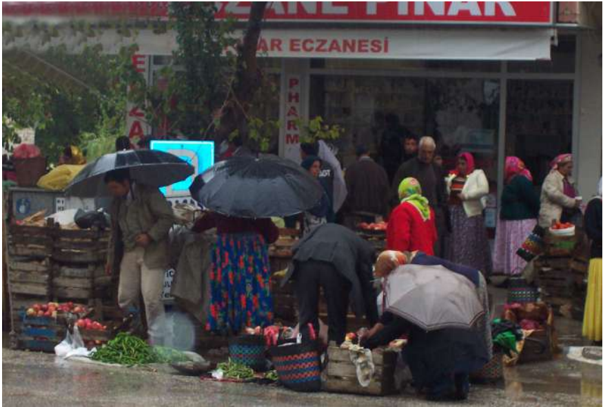
Karacasu'da Pazartesi Günü

Karacasu'da gelenek, görenek ve kültür bir nevi şenlikti pazartesileri. Sanki nabzı haftada bir gün atan bir canlı gibi. Pazar dengeleninceye kadar pazarlık devam eder, sonra bir ahenk tutturulur, kendiliğinden rayına otururdu işler ve alışverişler. Hesap verme, hesap alma, hesap görme günüdür pazartesileri. Herkes karınca gibi, arı gibi çalışır, evine bir haftalık erzak taşır. Herkes birbirini, anasını atasını tanır, kim nerenin malını satar bilinirdi. Dost düşman karşılaşır, hâl hatır sorulur, merhaba, iyi günler, günaydın, nasılsın, denir, çocuk çocuktan konuşulur hoşbeş edilirdi. Geçmiş olsun, gözün aydın, hayırlı olsun denir, toplum içine harç konurdu. İnsanlar borç alır, borç verir, geri öder tanışır, pazarlık ederken muhabbet kurulurdu. Bağırta çağırta içinde herkes