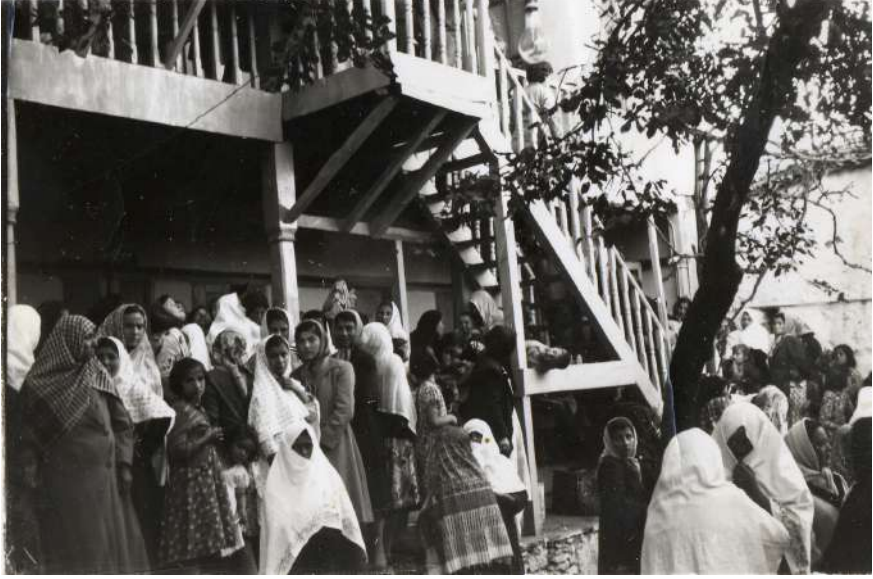
O Yıllarda Tekkeşin Mustafa Evinde Bir Düğün Günü