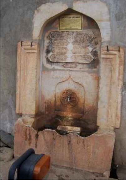
Hâlen Akan Eski Bir Çeşme

sosyal davranışların ortaya çıkmasına, bireysel huzursuzluğa sebep olur. Örneğin, cep telefonu (maddi kültür) hızla yaygınlaşmaktadır; ancak onu kullanma görgüsü (manevi kültür) aynı hızda gelişmemektedir. Bunun sonucu olarak toplu mekânlarda yüksek sesle konuşulmakta; tiyatro, cami gibi yerlerde cep telefonunun kapatılmasına özen gösterilmemektedir. Son model arabalar (maddi kültür varlığı) hızla değişirken bu arabaları kullanma disiplinemiz (manevi kültürümüz) aynı hızda gelişmemekte böylelikle şikâyetçi olduğumuz trafik sorunlarıyla karşılaşmaktayız.