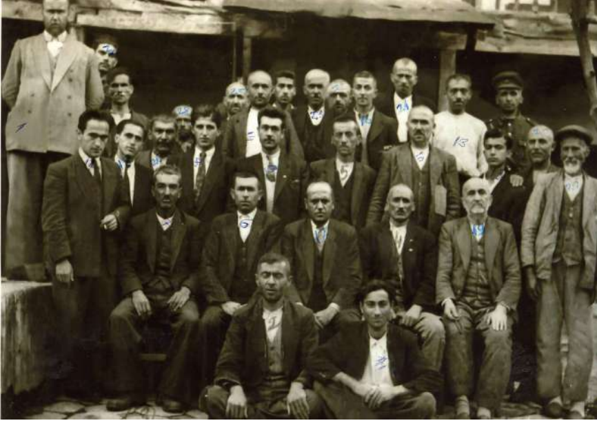
Dokumacılar Kooperatifi'nin İçinde Dokumacılar Ve Yöneticileri, 1955'ler

Karacasu dokumacılarına çölenme denilir. En ihtiyar dokumacılar da bu kelimenin nereden geldiğini bilmezler. 100 senelik nüfus kâğıtlarında bile çölenme yazıldığından söz ederler.