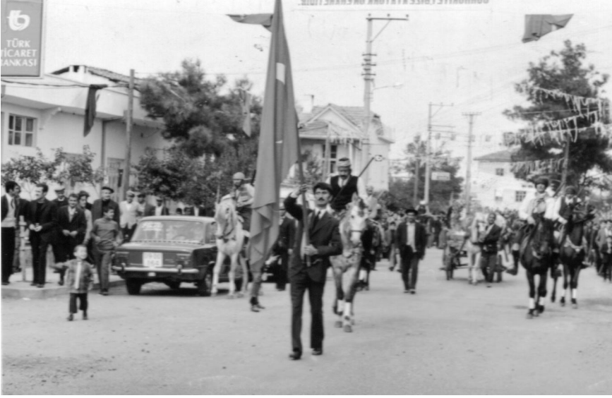
1970'lerde Pazar Yerinden Geçen Bayram Korteji, Acet Eczanesi Önünden Postaneye Doğru Düşünümüz

duymak istediğini duyar, işi neyse onu konuşurdu. Kasetçi kendi bağırılmazdı yeni çıkan ya arabesk ya türkü son sesinde karar bulurdu. Belediye bir haftalık diyeceklerini biriktirir, apollo dan o gün söylenirdi.