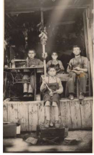
1953'lerde Karacasu'da Bir Dükkân

“O zamanları Karacasu Nazilli'ye göre çok küçük, eski binalardan oluşmuş bir ilçe merkeziydi. Parkı vs yoktu. Ama halkı Dokumacılar Kooperatifi sayesinde az çok maddi sıkıntı çekmiyordu. Kadınlar evlerde dokuma tezgâhlarında çalışarak aile bütçesine katkı sağlıyorlardı. Karacasuluların birbirilerine karşı saygısı, sevgisi vardı. Particilik başladıktan sonra bu saygı sevgi zedelendi. Saraçlık, kebaçılık, semercilik, nalbantlık gibi bugün olmayan sanatlar da vardı. Değirmenler ve fırınlar önemliydi. 1954'te elektrik geldiği için Kızılcaölük'ten pek çok Kızılcaöüllü, elektrikli dokuma tezgâhlarıyla dokumacılık yapabilmek için Karacasu'ya göçmüşlerdi. Ama bunlar da sonraları Karacasu'yu terk ettiler.” 6