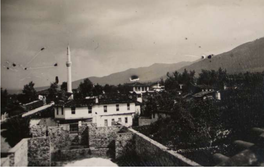
1938'lerde Karacasu, Resmin önündeki duvarlar Ziraat Bankası Binası İnşaatıdır.

Karacasu'da iki sene evvelsine kadar (1938) 1000 tezgâh vardır. Bugün çalışan tezgâh sayısı 600-700 arasındadır.