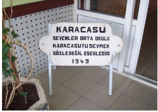
Karacasu Ortaokulu Kitabesi

Sonra da Karacasu Ortaokuluna atanışım. Yıl 1969. Çocukluğumun okuluna bu sefer öğretmen olarak ön kapıdan girişim. Öğrenciyken dikkatimi hiç çekmemiş olan; fakat öğretmen olarak