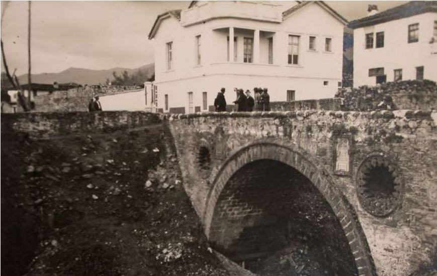
1938'lerde Postane Önünde Çarşıya Girişteki Köprü, Arka Planda Ziraat Bankası İnşaatı

Şehrin batı yönündeki Âlemler Mahallesi genişlik itibarıyla diğer sokaklardan daha geniş; fakat evleri eski stilde. Hele bir eski konağın göze çarpan dış manzarası Yakup Kadri Karaosmaoğlu'nun Eski Konak'ta tasvir ettiği evin aynısına benziyor. Bu cadde üzerinde bir doktorun otur-