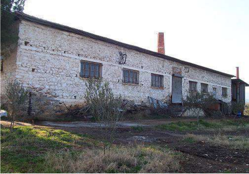
O Günlerin Boya ve Apre Fabrikasının Bugün Dıştan Görünüşü