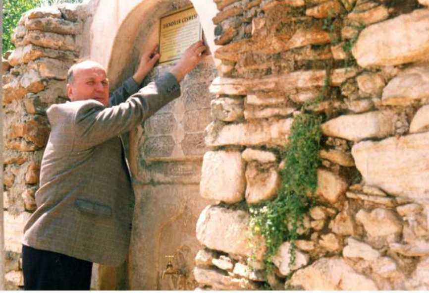
Çeşme Kitabelerini Levhalama Çalışmasını Yaparken