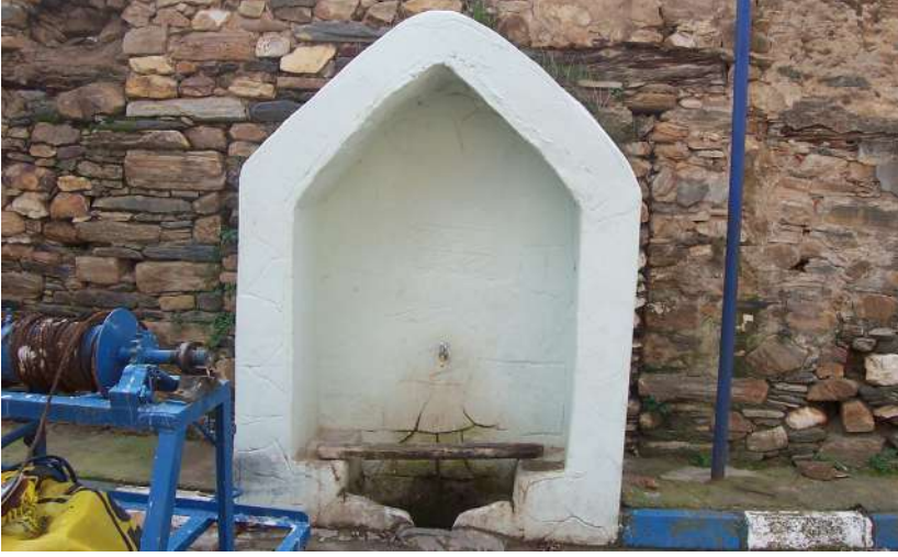
Hacı Salihler Çeşmesi'nin Bugünkü Hâli

Bu gayretlerimizden birisi koruma altında olan çeşmelerin saptayabildiğimiz öykülerini; özelliklerini, varsa belgelerinin ve kitabelerinde bulunan yazıların içeriğini açıklamaya çalışmamızdır.