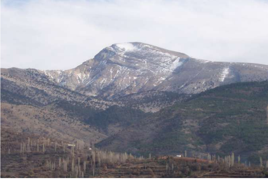
Yeniköy'den Babadağ'ın Görünüşü

ni ezberler. Yeniköy'ün hemen dibinde selvilerin hemen ucundadır Babadağ. Ha deseniz Babadağ hemen oradadır, o kadar yakındır Yeniköy'e. Söylenecek çokkkk hem de çokkkk söz var. Dağ sporları, köy turizmi... deyip durmak mümkün. Ne diyelim anlayana saz anlamayana davul zurna az.