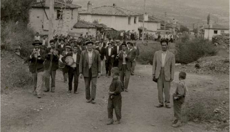
1965'lerde Karacasu'da Bir Düğün Alayı (Bugünkü Halısahadan Postaneye Doğru bakınız.)

Değişmeyen tek şey değişimin kendisidir.