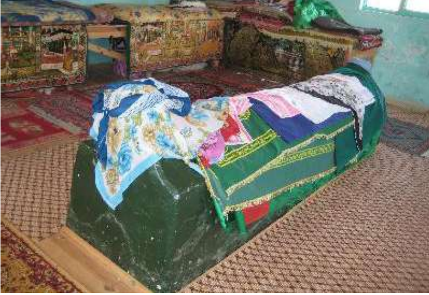
Şeyh Kemal Türbesi'nin İçi