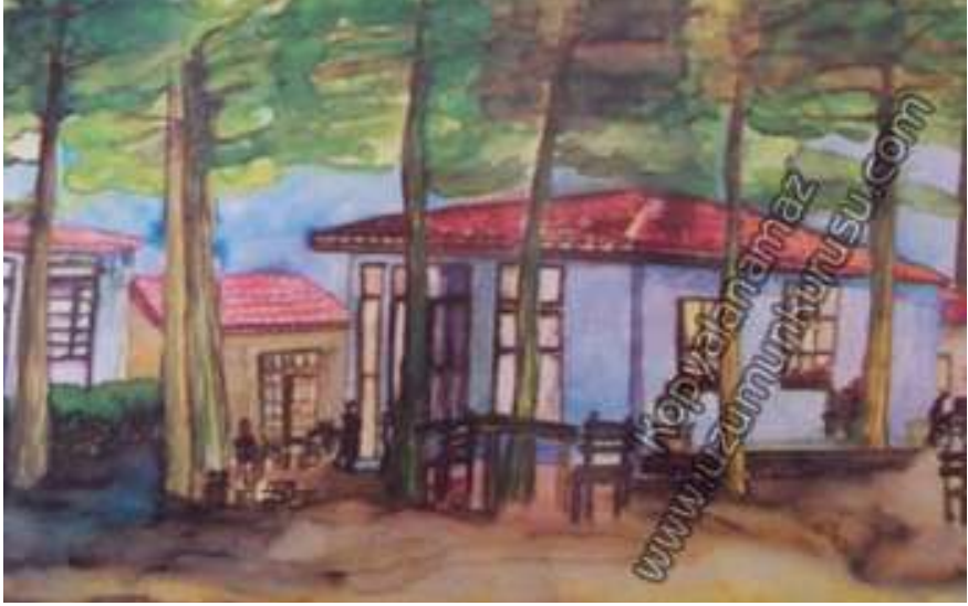
O Günlerin Park Kahvesi'nin Suluboya Resmi

alandaki çamlar altında 8 m çapında ve 80 cm derinliğinde yuvarlak, büyük bir havuz bulunurdu. Park Kahvesi kasabanın bütün siyasi toplantılarının yapıldığı, devlet büyüklerinin ağırlandığı bir yerdi. Hatta Adnan Menderes Karacasu'ya geldiğinde bu kahvede konuşmuştu.