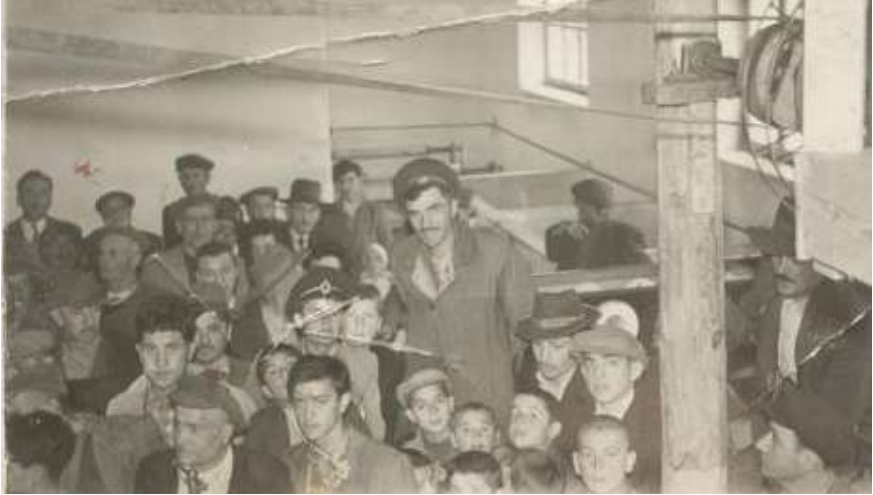
10.03.1957 Fabrikanın Açılış Günü Fabrikayı Gezenler

Fabrikanın açılış törenine 1000 kadar Karacasulu ve misafir katıldı. Tam çalgı tutulmuştu. Misafirler kasabadaki lokantalarda ağırlandı. Kurdele kesildi. Fabrikanın bir tren düdüğünü andıran vardiya düdüğü üç defa uzun uzun