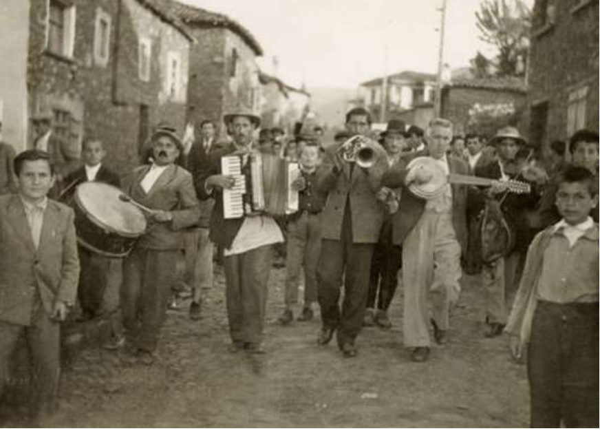
Cuma Önü'nde 1950'lerde bir Düğün Alayı

sesi çok uzaklardan duyuldu. Ben heyecandan yerimden kıpırdayamıyordum. Koruma askerleri ellerindeki palaskaları halkın geride durması için sağa sola sallıyorlardı. ‘Geri durun, Geri durun’ diye emirler veriyorlardı Halk sakinleşmişti. Benim gözüm kapılarda, pencerelerde. Bir müddet sonra Atatürk trenin penceresinde görüldü. Sanki gülüyor, ışılan bir ışık gibi duruyordu. Aslında bir şeyler söylüyor gibiydi. Ama ben hiçbir şey duymuyordum. Çok uğultu da vardı. Kimse trene yaklaşamıyordu. Ben Atatürk’ü görmek mutluluğundan kendi kendime ağlıyordum. Askerler bıraksalar koş a koş gider ellerinden öperdim. İşte o an tekrar onun askeri olmak istedim.” dedi ve sustu. Dedemin yüzüne baktım gözlerinden yaşların süzüldüğünü, sakallarına doğru indiğini, ıslattığını gördüm. Uzun boylu sakalı her zaman düzgün, yumuşacık gelirdi bize. Yüzünden gülümsemesi hiç gitmezdi. Şakacı bir adamdı. Her gün Cami önündeki kahvelerde kendisi gibi gazi arkadaşlarıyla buluşurdu. O askerlik anlarını anlatmaktan hoşlanmazdı. Daha çok dinlerdi.