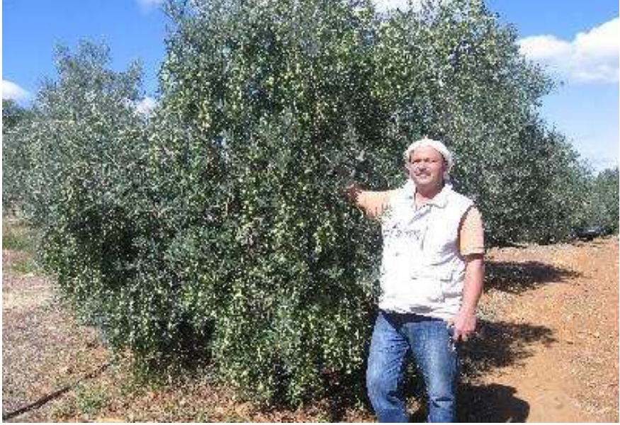
Erdoğan Orçun Bahçesinde