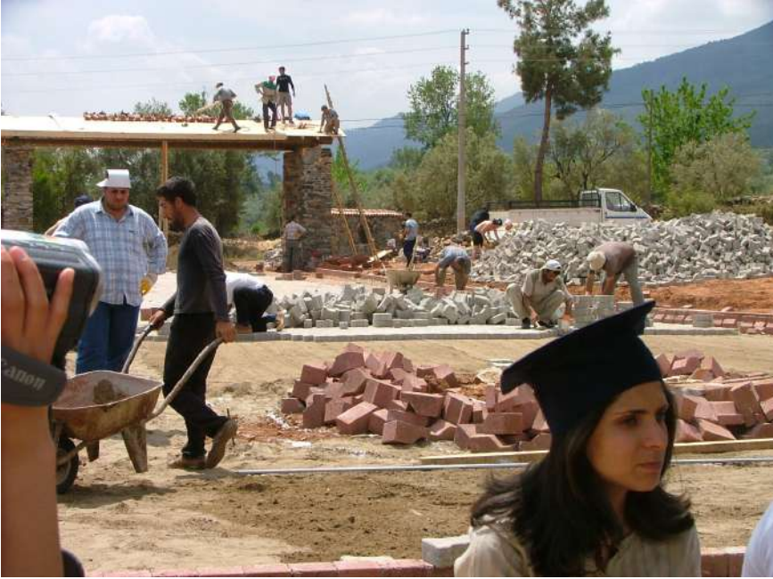
Yüksekokul Kuruluşunda Bahçe Tanzim Çalışmalarına Fiilen Katılan Öğrencilerimiz

Sonunda Aydın içinde en güzeli denen bir yüksekokul kuruldu. İrfan Bezci, karşılıksız olarak o okula 250.000 TL, Muzaffer Özuysal da 80.000 TL harcadı. İnci Holding koca bir bina yaptı. Bunlar ve Karacasu halkının binlerce TL tutan bağışları o okulu inşa etti.