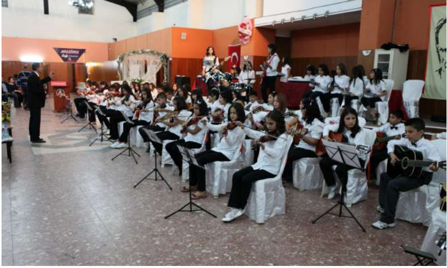
Bir Okul Uygulaması

Gönlümün deli kuşunu bu okulun kuruluşu için önyak olan ve okula verdikleri anlamlı isimle bugünün insanlarına bir misyon da yükleyen; Alirıza Uğurlara, Salih Alpazlara, Ahmet Altıntaşlara, Osman Çilingiroğullarına uçurdum. Onların manevi varlıklarını saygıyla andım.