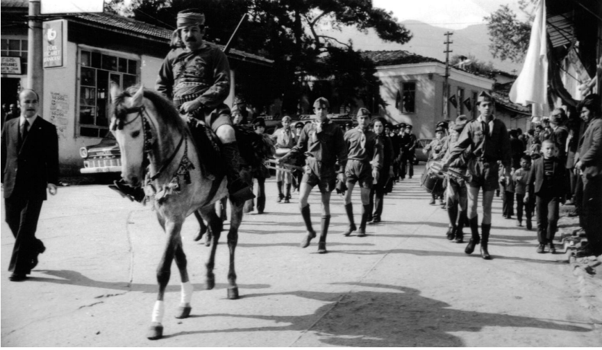
1972'de Karacasu Ortaokulu Bir Bayram Yürüyüşünde, Dua Meydanı'nda

Ne demiştim yukarıda? Bizim ruhumuzdan yazıya duygularımız, düşüncelerimiz satır satır düşerken memleketimizden, dağlarımızdan, kasabalarımızdan, yaylalarımızdan da hiç farkına varamadığımız biçimde bizim ruhumuza, bizim düşüncelerimize de efil efil bir şeyler akar durur. Ve biz bu gelgitlerle o beldenin, o memleketin mührünü ruhumuzda taşırız. Duygularla, seslerle, görüntülerle ruhumuza işleyen memleketimizi bir sevgili gibi sever, bir bebek gibi koruruz. İstesek de istemesek de ruhumuzun en derinliklerinde duran memleket çizgilerini silemeyiz.