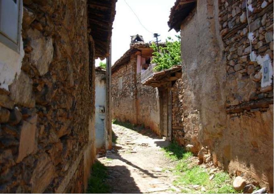
Karacasu'da Eski Bir Sokak

lerine doğru bir koyun sürüsü, öndeki kepenekli çobanının ardından çanlarının çıkardığı seslerle birlikte melemelerle geçirdi. Akşam ezanı ALLahü Ekber diye duyuldu mu bütün çocuklar “evli evine evi olmayan saman deliğine” diyerek evlerine giderlerdi. Masal perisi, her çocuğun evine gidip gitmediğini kontrol ederdi. Bu sebeple de ezan sonrası sokakta hiç kalmazdı çocuklar. Nisan yağmurlarının en güzel eğlencesini bir mahalle şenliğinde yaşadık. Mahallenin bütün çocukları hep beraber toplanıp, ellerine küçük sepetler, evde yapılmış keseler alırlar ve yağmur şenliğine çıkarlardı. Sokağın ilk evinden başlayarak o evin önünde hep beraber: