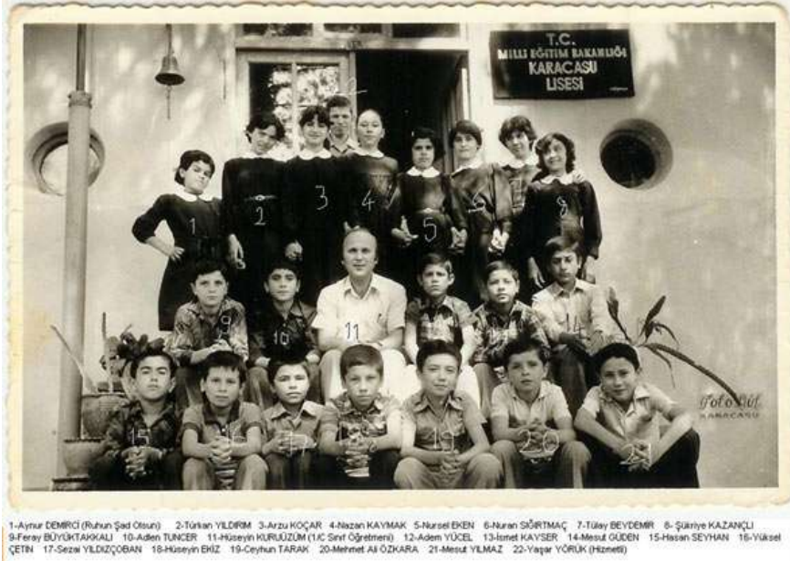
Karacasu Lisesinde Öğrencilerimle